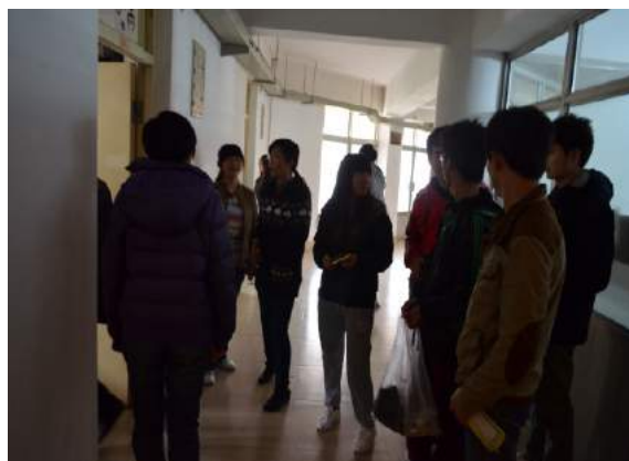
文：赵子涵 于治延 图：李本浩

2013年3月6日晚8时，我院学生会宿管部对我院学生所在宿舍进行了一次大检查，我院各专业辅导员以及宿管部全体成员进行此次检查。本此检查提高了我院各宿舍的卫生环境和同学们的安全意识，同时让同学们了解了大功率电器的危害，在防范火灾安全的问题上进行深刻的教育，深入贯彻了潍坊学院保护学生消防安全的基本准则，希望在今后，我院学子能够继续严格要求自我，营造一个安全健康积极向上的宿舍环境。