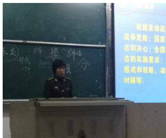
文：赵子涵 于治延 图：常昊宇

2013年4月13日，为增强大学生国防观念和国家安全意识，强化爱国主义、集体主义观念，加强组织纪律性，促进大学生综合素质的提高，我院特邀济南军区学生军训教研室郑艳君老师在6214教室为莘莘学子进行演讲。此次活动，提高了同学们的国防意识，使同学们深深的认识到国家的发展需要我们做出不懈地努力，积极维护国家的利益，坚决反对独立，为国家的兴旺贡献力量。