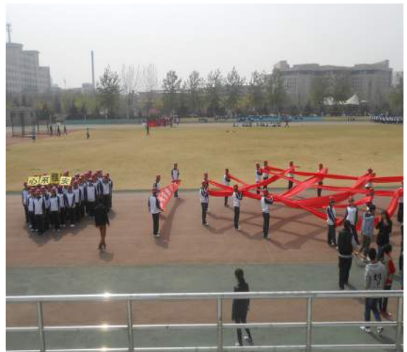
文：咸喜美

2013年4月25日早8点，我院在我校运动场组织了运动会开幕式方队训练活动，此次训练的方队成员由我院2012级的同学们组成。方队队员们也从训练中学会了坚强和强烈的团队意识。每天的训练磨砺了同学们的意志，提高了同学们相互合作的能力，而且方队展示在运动会中十分重要，不仅展示我系精神面貌，更是我系整体水平与实力的体现。相信通过我系方队认真刻苦的训练，定会一展我院风采，在运动会的赛场上形成一道亮丽夺目的风景线。