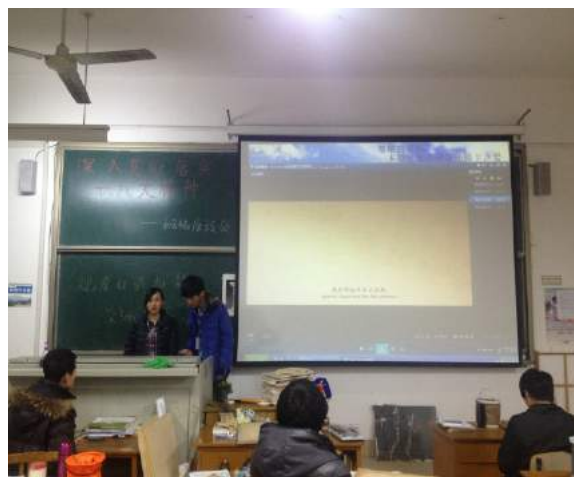
文：赵子涵 于治延 图：李本浩

2013年3月29日，我院建筑学（一）班于在8号楼8334教室举办了红色电影观看的团日活动，此次观看的红色电影为冯小刚的《一九四二》，通过这次活动促进班级成员之间的交流，加强班级的内部建设。通过展示影片让大家发现自己内在的潜能，但更重要的是加深了同学们对团的认识，激发了同学们的爱国热情，让我们每个人都重新接受了一次爱国主义教育而且激发了团员的先锋意识，很好的展现了大学生的青春风采。