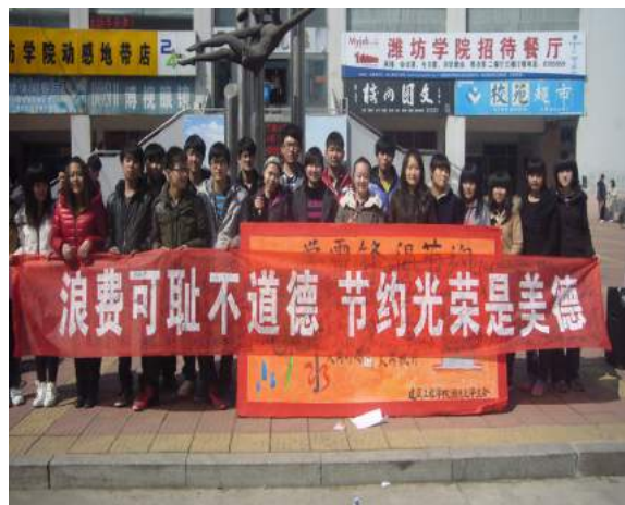
文：赵子涵 于治延 图：常昊宇

2013年3月26日上午11时，由我院心桥志愿者协会与学生会团总支联合举办的“雷锋月倡节约暨志愿者签名活动”在第二餐厅前正式启动。此次活动的目的是为了增强全校师生的节能减排意识，响应国家“十二五”规划。此次活动意义重大，突出节能减排的现实意义，并把它作为促进科学发展的重要手段，作为检验科学发展观是否落实的重要标准，表明了在未来一段时间内这一任务的重要性和紧迫性。作为当今社会的一员，我们要共同努力，立足本职，尽心尽力，将节能减排工作一直持续下去。