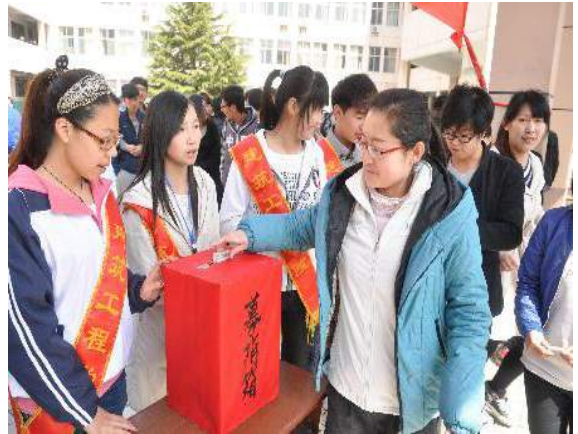
文：咸喜美

2013年4月23日，在雅安地震三天后，我院组织了一场援助雅安灾区的募捐活动，得到了师生的广泛支持。目前通过各渠道共收到捐款7434.3元以及一些常用衣物用品。此次募捐传递了潍院学子支持抗震救灾的坚定信心和与灾区人民心连心的火热情感。同学们用实际行动告诉灾区人民，我们与他们同在，与他们一起面对灾难。在本次活动中，全校师生再度接受了一次心灵的洗礼，体验到了自己的社会责任感。我们满心期待，我们的行动能为灾区重建尽到微薄之力。