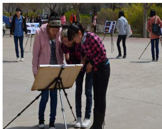
文：赵子涵 于治延

2013年4月18日，为了培养全院学生对摄影的兴趣，提高大家的摄影技术，同时丰富大家的课余文化生活，为大家营造轻松、快乐的氛围，我院学生会编辑部和网络部在社团广场举办了以“美丽中国”为主题的建筑摄影大赛。寻找建筑气息，增添校园文化，宣传普及建筑知识，让同学们在今后的生活和学习中用心了解周围建筑，感受建筑生命与自然融合的魅力。了解建筑、观察建筑、学习建筑，从不同的视角、不同的空间、不同的环境用不一样的思维方式去感受。建筑——灵动的生命，生命因建筑而更加灵动。