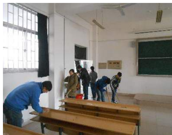
文：赵子涵 于治延

2013年3月23日，潍坊学院建筑工程学院为了引导广大青年学生继承优良传统，弘扬雷锋精神，组织开展了“以实际行动缅怀雷锋同志，弘扬雷锋精神”系列活动，广大学生积极参与，奉献爱心，用自己的实际行动诠释永恒的雷锋精神。参加这次活动的人员有建筑工程学院全体学生会成员和全体班委。。雷锋同志曾经说过“人的生命是有限的，可是，为人民服务是无限的。我要把有限的生命，投入到无限的为人民服务之中”。虽然雷锋同志已经走了，但是我们要将雷锋精神传承下去。雷锋在心中，我们在行动。