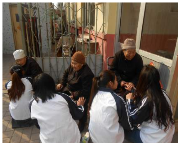
文：宋娇娇 图：常昊宇

2013年3月31日早8点，由我院社会实践部举办的“走近坊子社区敬老院，与老人贴心交流”活动正式开展，在此之前，实践部成员做了大量的准备工作，活动顺利开展，实践部成员为老人们带来了一个又一个精彩的节目，从老人们的脸上可以看出他们喜悦的心情，洋溢着幸福的笑容。此次活动不仅为敬老院的老人带去了欢乐与温暖，还让大学生们更深刻地体验到应该如何敬老爱老，如何去感恩！让我们一起关爱老人，将爱的火炬永远传递下去。