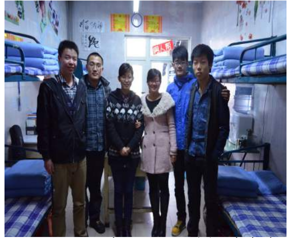
文：尹云飞 图：李本浩

为了响应国家要求，将学生宿舍建成整洁、优雅、团结、文明的生活场所，同时也为了培养大学生的集体意识，调动广大学生对内务工作的积极性，由建筑工程学院宿管部、女生部联合承办了宿舍文化节活动，建筑工程学院辅导员办公室各个领导参观了星级宿舍并进行了挂牌仪式。此次宿舍和先进个人评比活动，激发了同学们爱校园、爱宿舍的热情，增强了他们的团队合作精神和寝室成员间的凝聚力，推动了校园精神文明建设。