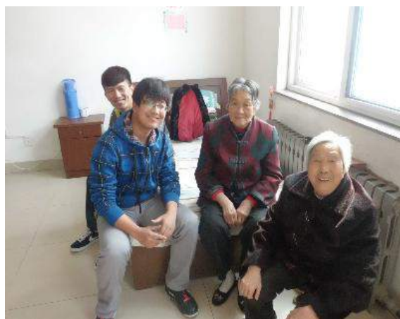
文：咸喜美 于治延

2013年3月5日，我院的志愿者走近曹家巷社区敬老院与老人进行手牵手，心贴心的交流，为老人们送上了我院全体师生的深情问候。作为一名大学生，我们需要的并不只有书本上的知识，更多的我们还要学会心系社会，此次活动不仅为敬老院的老人们带去了欢乐与温暖，还让大学生们更深刻地体验到应该如何敬老爱老，懂得如何去感恩！让我们一起关爱老人，将爱的火炬永远传递下去。