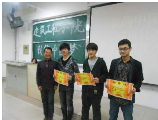
文：宋娇娇

2013年4月2日晚19时，由我院女生部承办的规划明天，展望未来——暨“我的中国梦”演讲比赛在6号教学楼207教室顺利举行。“我的中国梦”演讲比赛是校园精品文化活动之一，以深入学习贯彻党的十八大精神，全面贯彻党的教育方针为目标，教育引导广大学生结合中华民族灿烂辉煌的历史，结合新中国取得的伟大成就、中国特色社会主义建设伟大实践，结合自身经历感受和人生规划，讲述自己的“中国梦”。