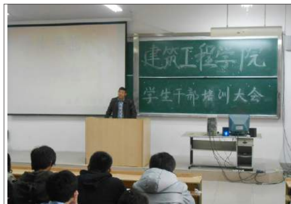
文：赵子涵 于治延 图：李本浩

2013年3月16日下午4点，为使学生干部能够尽快的熟悉各部门工作，进一步提高自身素质，更好的为广大学生提供更优质的服务，我院于在致远楼6202教室举办了以“学生干部培训”为主题的学院学生干部培训大会，出席本次大会的有我院院长柳长江、学生会主席周军鹏以及学生会成员、团委干事等。