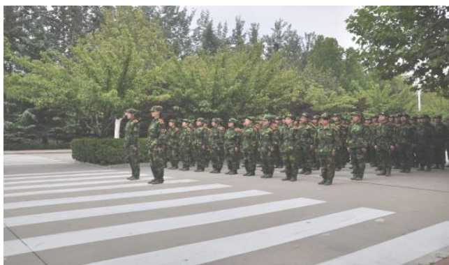
图 / 刘青云