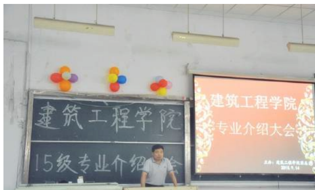
图 / 刘青云