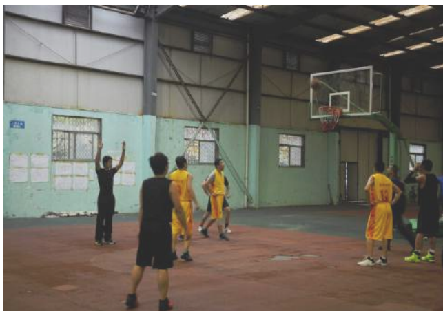
图 / 段敏慧

11月4日，第十五届教职工篮球赛决赛在风雨篮球场举行。建筑工程学院取得了第二名的佳绩。