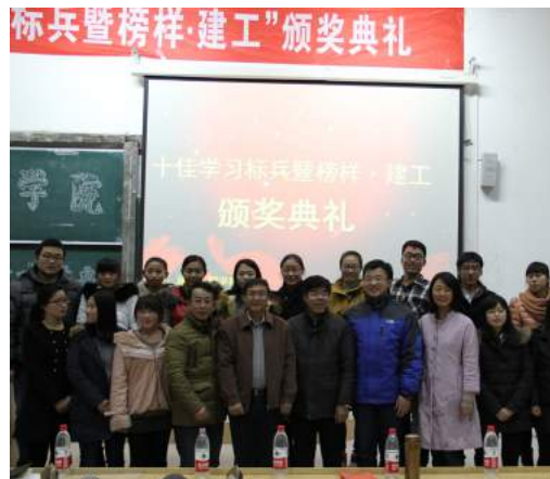
十佳学习标兵暨 榜样·建工颁奖典礼